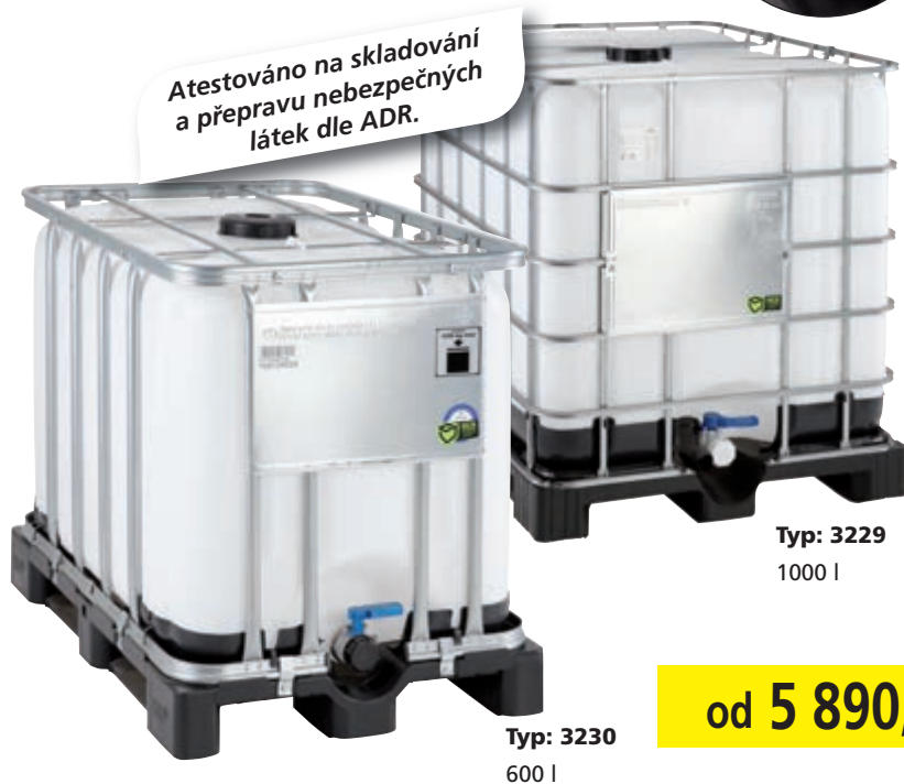
Typ: 3229 1000 l

Atestováno na skladování a přepravu nebezpečných látek dle ADR.